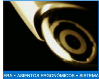
ERA • ASIENTOS ERGONÓMICOS • SISTEMA