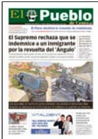
PORTADA DE HOY