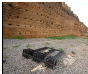
MURALLAS MERENÍES. ARCHIVO.

ACTUALIDAD POLITICA SUCESOS ECONOMIA SOCIEDAD CULTURA MELILLA DEPORTES OPINION ARCHIVO ESPECIALES